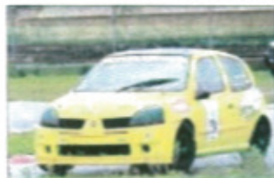
Sul circuito internazionale Pista Salentina, il 4 e 5 novembre prossimi si corre il "4° Salento Challenge Race", organizzato dall'Asd Motorsport Scorrano. Le iscrizioni si chiuderanno giovedì 2 novembre

Sono attese le sfide tra vetture sport E2, tra prototipi P2 o tra le monoposto; oltre a quelle da Turismo. Al via della gara ci saranno anche due ragazzi di 16 anni, che grazie ad un corso federale Aci Sport, potranno sfidare i piloti più esperti. A corollario della gara sul circuito salentino è prevista la presenza di un simulatore di Formula Uno, di una esposizione di Auto Tuning, di un Raduno di vetture Mustang e del il Test Drive di vetture Ford della MPM Ford Store.